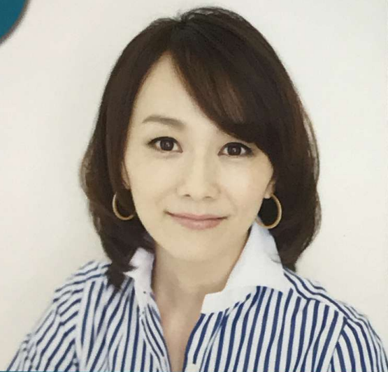
フリーアナウンサー 木佐 彩子